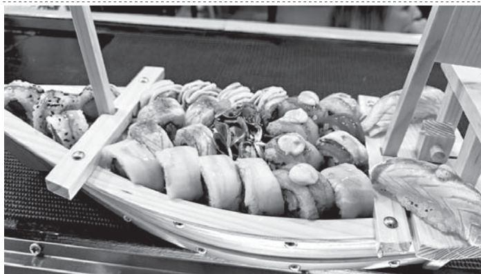
Barca de Sushi. VIVA