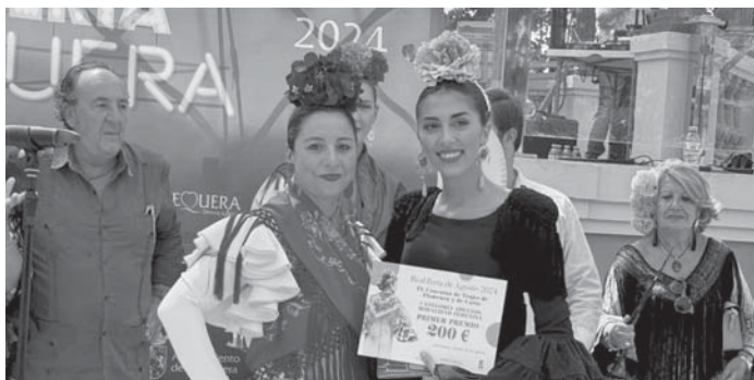
Concurso de trajes de flamenca. VIVA

ANTEQUERA El concurso contó con un total de 17 participantes