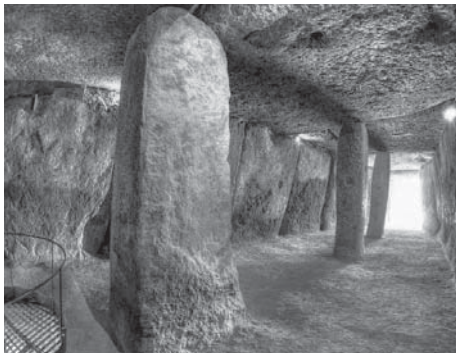
Interior del Dolmen de Menga VIVA

El estudio demuestra que los constructores neolíticos poseían un conocimiento