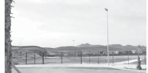
Puerto Seco VIVA

La empresa adjudicataria realizará diariamente la limpieza de los jardines del área