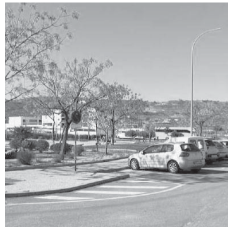
Parque Verónica VIVA

La actuación permitirá la regeneración de dos espacios libres en Antequera, actualmente divididos por una vía para vehículos que será transformada en una senda peatonal y ciclista. De esta forma, se creará un amplio espacio destinado al uso ciudadano. El proyecto contempla la eliminación de la calzada para vehículos, la refo-