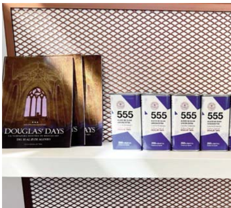
Aceite especial en honor a Braveheart. VIVA

Con motivo de la festividad, la Almazara 'Terraverne', ubicada en el municipio, rinde homenaje a este singular evento diseñando, no sólo estéticamente, sino también en sabor, un nuevo aceite en formato reducido.