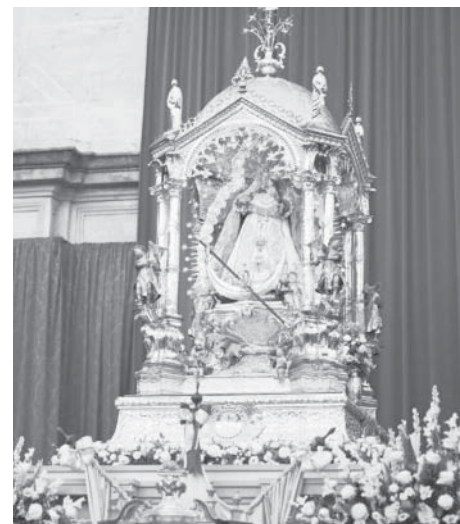
Virgen de los Remedios. VIVA

El 8 de septiembre llegará el día grande de la Patrona Mariana en Antequera, con la Eucaristía y posterior procesión que tendrá su salida desde la iglesia de los Remedios y recorrerá calle Infante don Fernando, Lucena, Cantareros, San Luis, Infante don Fernando, y a su templo.