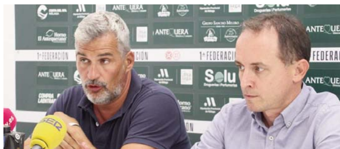
Rueda de prensa VIVA

ataque, lo que les hizo sucumbir ante el ritmo de su rival. El choque se fue 8-16 al descanso. Tras el paso por vestuarios, el Dólmene intentó despertar y comenzó bien, pero la distancia era gigantesca y fue aumentando con el paso de los minutos. El marcador final fue 22-30 para Triana y los antequeranos se quedaron sin final andaluza.