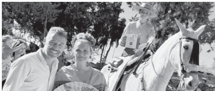
Varios ganadores del concurso. VIVA