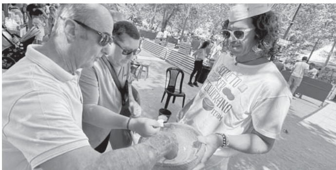
Participantes en el concurso de porra. VIVA

ANTEQUERA | Después de un año de paréntesis, Antequera volvió a poner a prueba las habilidades de vecinos y visitantes en la elaboración de uno de sus platos insignia: la porra.