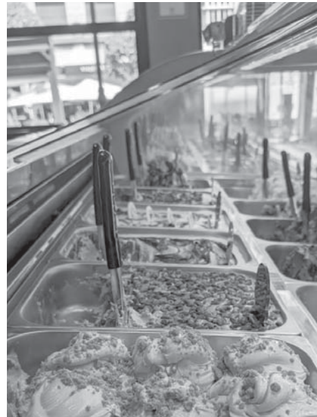
Vitrina de helados. VIVA

Para acompañar estas bebidas, el establecimiento ofrece una gran variedad de dulces entre los que se incluyen crepes, batidos, cookies, y brownies. Esta combinación de productos ha convertido a D’Lorenzo en un must