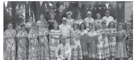
'AYNI' Campillos 2023. VIVA

«Este evento sigue aunar sinergias y esfuerzos de compañeras y compañeros de otros territorios, de otros pueblos, culturas y países, con quienes se ha ido tejiendo, construyendo y reforzando una red de complementariedad y reciprocidad en la que no sobra nadie, ninguna cultura, ninguna comunidad... ninguna persona. Gracias a todo ello AYNI se ha convertido en un auténtico proceso de convivencia y cohesión social en Campillos», destacan des-