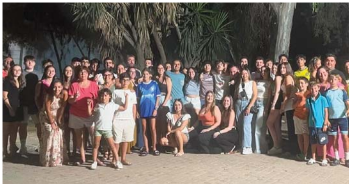
Semana de la Juventud en Fuente de Piedra. VIVA

Una semana llena de diversión, juegos y cultura para los más jóvenes que volvió a consolidar su éxito tras ocho años de celebración en el municipio.