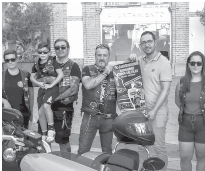
La presentación del evento. VIVA

La jornada promete no solo ser una celebración del motociclismo, sino también un punto de encuentro para fortalecer lazos entre los participantes los vecinos de la localidad. El éxito del evento el año pasado ha sentado las bases para que esta tradición continúe en Archidona, atrayendo a visitantes de distintas partes del país y del mundo.