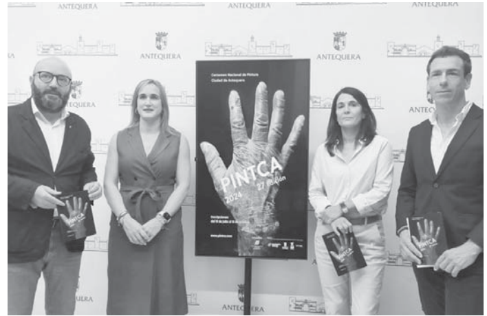
Presentación del Certamen en el Ayuntamiento.

El plazo de inscripción se iniciará el 15 de julio hasta el 15 de octubre de 2024. Los ar-