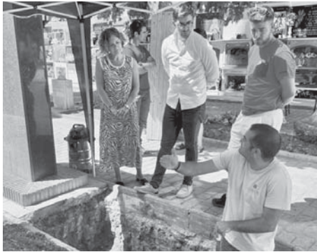
Fosa común en el cementerio de Campillos. VIVA

El equipo de trabajo que está llevando a cabo este proyecto ya dispone del material necesario para las pruebas y el Ayuntamiento habilitará una sala en el edificio AYNI (antigua UNED, en avenida Santa María del Reposo) entre el lunes 2 y el jueves 5 de septiembre, de 18:00 a 20:00 horas. El objetivo es recoger en ese periodo muestras de ADN al mayor número posible de familiares de las vícti-