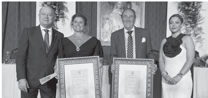
Nombramiento del pregonero y la regidora.