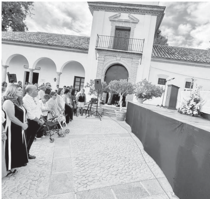
Misa en honor al Cristo de la Verónica. VIVA

Actos que fueron el preludeo a la celebración de la Real Feria de Agosto de Antequera, que tuvo su inicio el miércoles 21.