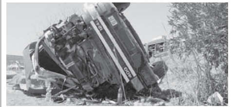
Vehículo accidentado en Teba. VIVA

Según confirmaron las fuentes consultadas, no ha habido más vehículos implicados en el siniestro.