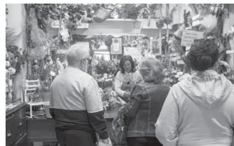
La Gardenia. VIVA

Los floristas se encuentran en calle Lucena número 16 Bajo.