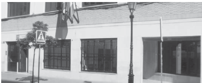
Centro de Participación Activa. VIVA

13 de septiembre. En total, el contrato se divide en seis lotes, que abarcan desde mobiliario y decoración hasta equipamientos especializados, con el fin de dotar a los centros de recursos modernos y funcionales. Además de Antequera, los CPA de Coín, El Perchel y Marbella en la provincia de Málaga también serán acondicionados, destacando la importancia de esta inversión para mejorar los servicios destinados a la población mayor en la región.