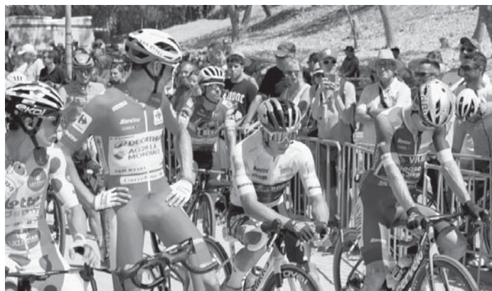
Vuelta Ciclista 2024 en Archidona. VIVA

Rosas mencionó que tanto Archidona como otras localidades fueron beneficiadas por el paso de la Vuelta.