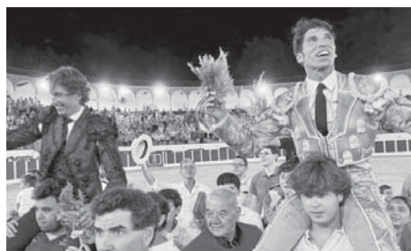
Momentos de los festejos taurinos.