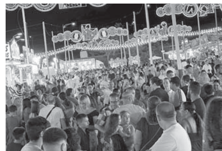
Recinto ferial. VIVA

Además, también destacan la gran repercusión económica de las fiestas, centrada en el desarrollo de la Feria de Día con el trabajo de las cofradías, y los caseteros en el recinto ferial. "Un trabajo de puesta en valor de las tradiciones: con la actuación de verdiales, concursos en el Paseo Real y el enorme peso que ha ganado el mundo del caballo".