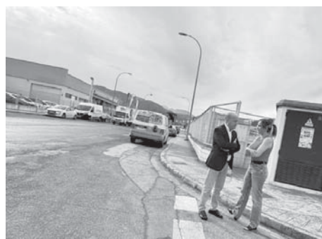
Visita al Polígono VIVA

Los dos desfibriladores, que estarán conectados al 061