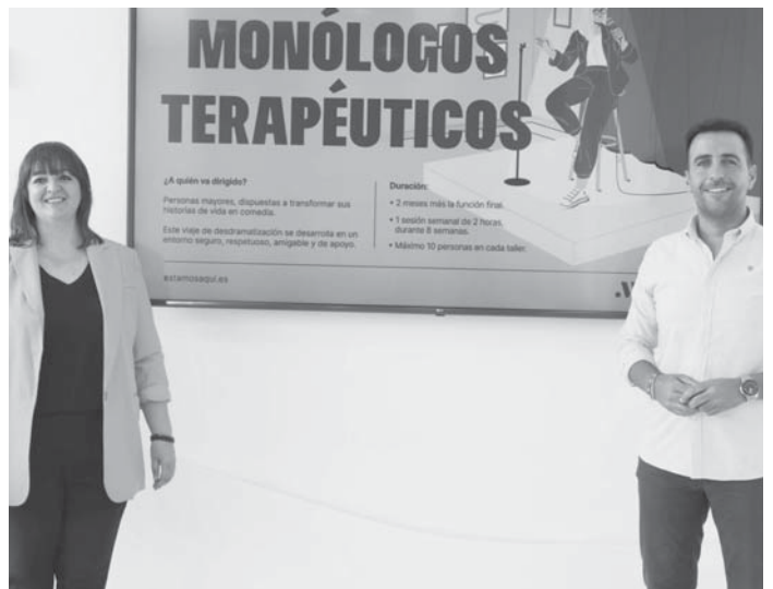
Durante la presentación de la actividad. VIVA

Los talleres concluirán con una función final en el auditorio del municipio. El 2 de noviembre será en Benarrabá; el 3 de noviembre, en Yunquera; el día 9, en Benamargosa, y el 10, en Villanueva del Rosario.