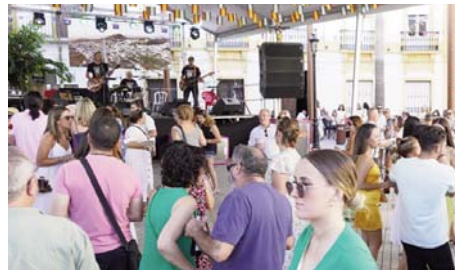
Feria de Cañete la Real. VIVA

nas mayores del municipio. El sábado y el domingo de feria arrancaron a las seis de la mañana con la diana floreada y, desde las 11:00 horas, se celebró la fiesta del agua en la piscina municipal. Durante el fin de semana se ofreció servicio de ludoteca en el pabellón municipal, donde niños y niñas se divirtieron participando en diferentes actividades mientras los padres también tuvieron la oportunidad de disfrutar del ambiente de la feria.