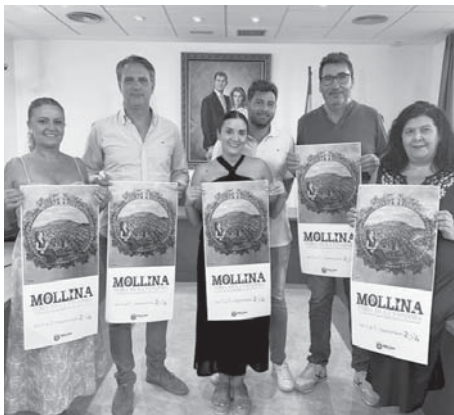
Durante la presentación de la Feria de la Vendimia. VIVA

Como antesa a la fiesta del vino, durante toda la semana habrá catas y talleres enológicos dirigidos por Bodegas Carpe Diem y Bodega Cortijo la Fuente, y el jueves