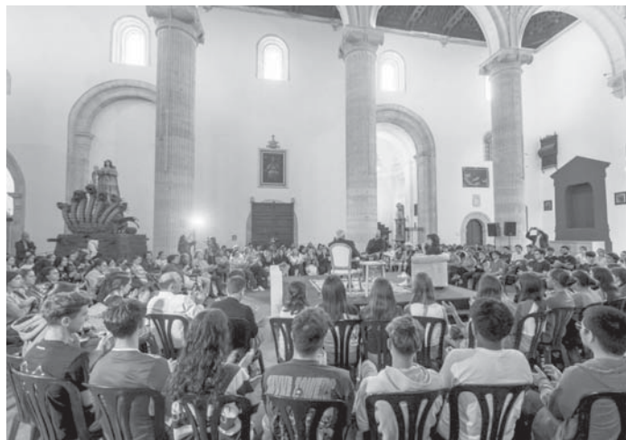
Primera sesión.