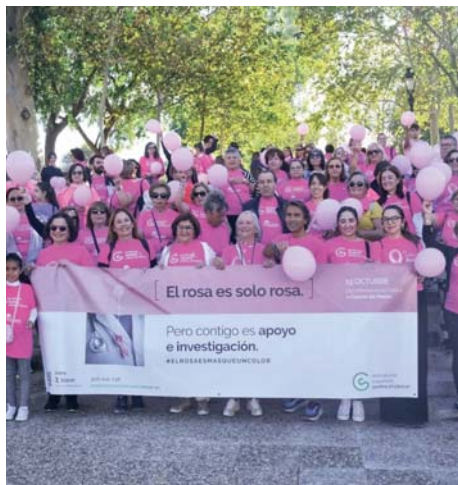
Marcha rosa en Antequera VIVA

Actualmente, la AECC de Antequera atiende a un centenar de personas con todo tipo de cánceres en la comarca. En junio de este mismo año consiguieron un vehículo, financiado por el Ayuntamiento, para trasladar de forma gratuita a pacientes con cáncer y sin recursos hasta el hospital. Ahora han ampliado la plantilla con la incorporación de una traba-