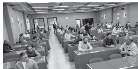
Candidatos en la prueba VIVA

La prueba se llevó a cabo el pasado sábado en las instalaciones municipales de la Escuela de Empresas del Polígono Industrial. Las personas que hayan superado esta