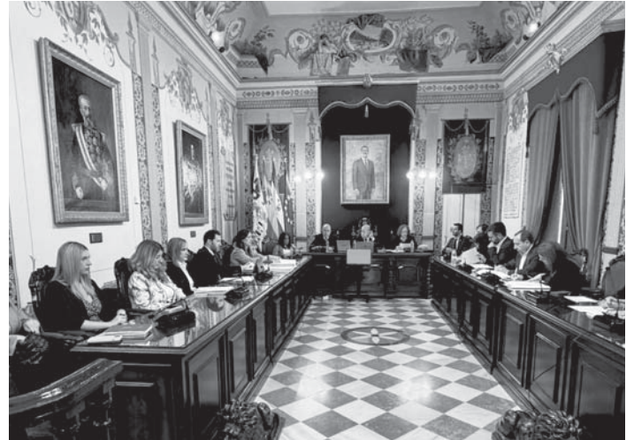
Pleno Ayuntamiento de Antequera VIVA

“El alcalde ha revisado y enriquecido el proyecto personalmente con el objetivo de convertir a Antequera en una ciudad moderna y sostenible alineada con los ODS”, ha señalado. Entre los 29 proyectos