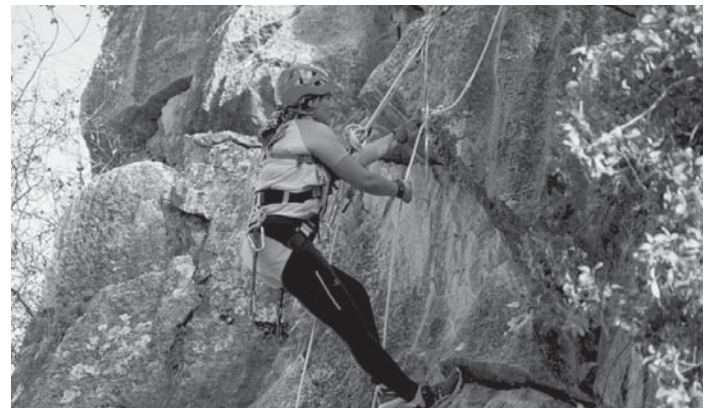
Participante en el Campeonato de Técnicas de Cañones. VIVA

Desde el Ayuntamiento se ha hecho una valoración muy positiva de la organización del 'II Campeonato Andaluz' y el 'I Open Nacional de Técnicas de Cañones', ya que eventos de este tipo contribuyen a dar a conocer la riqueza patrimonial, paisajística y medioambiental de Cañete la Real, al mismo tiempo que promocionan la imagen del municipio como escenario ideal para practicar diversas actividades y deportes en contacto con la naturaleza, como carrera por montaña y senderismo, entre otras.