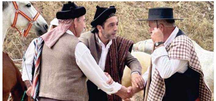
Recreación histórica VIVA

Tras el pregón de las fiestas, tuvo lugar el acto homenaje a los abuelos y a los niños de la feria, así como la proclamación de las damas, los caballeros y el nombramiento de la madrina y padrino de estas fiestas tan relevantes para la localidad.