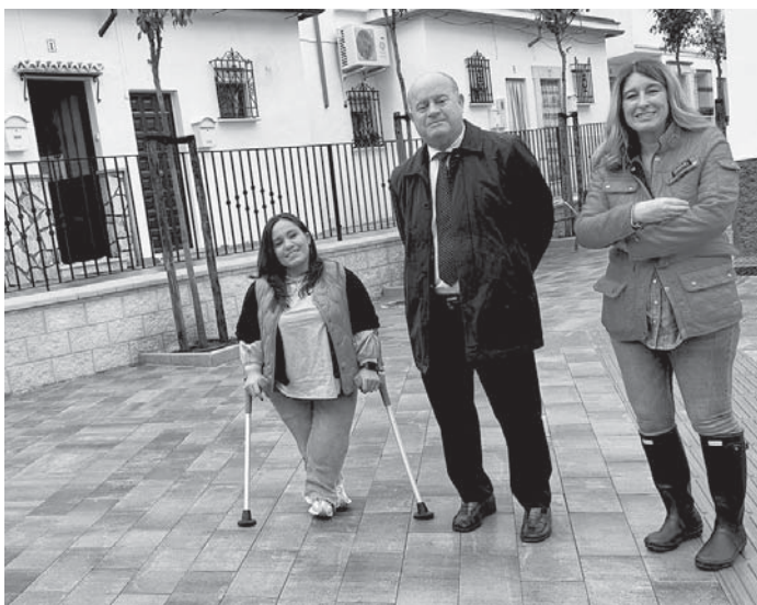
Visita a las obras. VIVA

El alcalde ha mostrado su satisfacción por llevar a cabo una nueva actuación de mejora en el barrio Girón, contribuyendo además a la revalorización de las viviendas de dicha zona. Cabe destacar