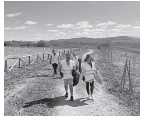
Voluntarios recogiendo basura en la Laguna. VIVA

La actividad no solo ha contribuido a limpiar la zona, sino que también ha fomentado la