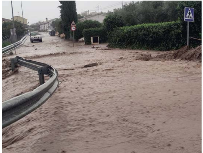
Inundaciones en la pedanía de la Higuera. VIVA