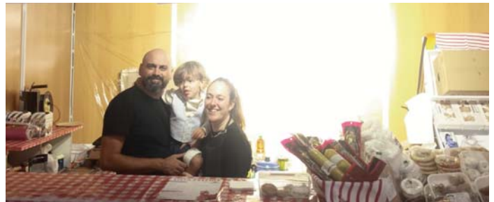
Puesto de Comestibles Clara en el mercado agroalimentario VIVA