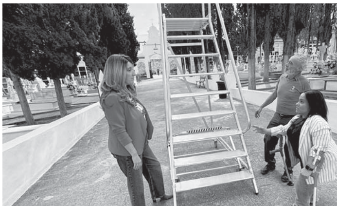
Visita de concejalas y técnico al cementerio.

Por la festividad de Todos los Santos, el cementerio municipal de Antequera contó con un horario especial de apertura. El jueves 31 de octubre y el viernes 1 de noviembre abrió sus puertas de ocho de la mañana a seis de la tarde, mientras que el sábado 2 de noviembre lo hizo de nueve de la mañana a dos y de cuatro a seis. También hubo misa con motivo de la conmemoración del Día de los Fieles Difuntos el sábado 2 de noviembre en la capilla del cementerio de Antequera.