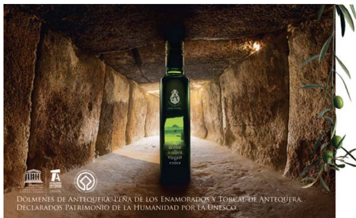
DOLMENES DE ANTEQUERA. PEÑA DE LOS ENAMORADOS Y TORCAL DE ANTEQUERA. DECLARADOS PATRIMONIO DE LA HUMANIDAD POR LA UNESCO.