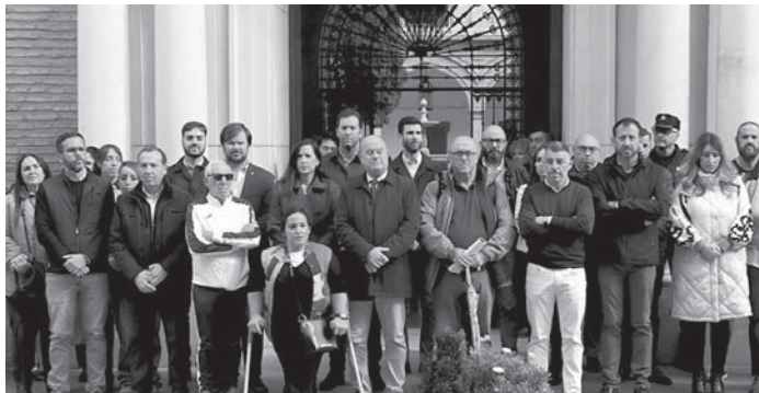
Minuto de silencio. VIVA

El pasado viernes, la Corporación Municipal realizó en la puerta del Ayuntamiento un minuto de silencio en memoria de las más de 200 víctimas al cierre de la edición de este periódico Las 4 Esquinas que han perdido la vida por esta catástrofe natural, la peor DANA en España que se recuerda en el último siglo.