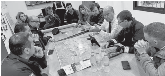
Reunión de evaluación de daños. VIVA

ANTEQUERA El cementerio de Antequera ha contado esta semana con un horario especial de apertura por el Día de Todos los Santos