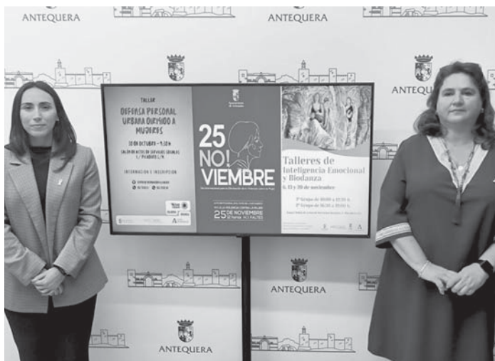
Presentación de las actividades VIVA