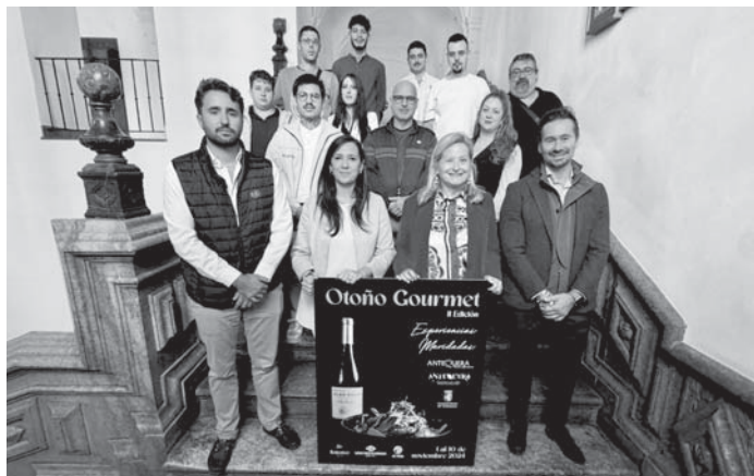
Presentación de la propuesta.

sotto con castañas), Anfitrión (Caducifolío Otoñal), Antequera Golf (Costillas a baja temperatura con migas del pastor y puré de chirivía), Baraka Restaurante (Pío de Otoño), Casa Carlos (Gazpachuelo con mahonesa de AOVE de Antequera), Casa Lucía (Terrina de conejo a las finas hierbas con setas de temporada y crema de castañas), Casa Paco (Pío de Antequera con naranja de otoño), Caserío San Benito (Potaje de verdinas con chivo lechal malagueño), La Fábrica (Ragú de ciervo con setas de otoño y patatas agrías de la Vega fritas al perol), Mesón Adarve (Champiñón Portobello relleno de dos quesos de cabra del Torcal y roquefort de oveja), Mesón Saborío del Acebuche (Porrilla de setas de cardillo con huevo), Nela Sushi Bar (Sopa ramen con panceta o gambones a la plancha), Parrilla San Bartolomé (Portobello ‘El Monarca de los Champiñones’), Restaurante Chicón (Carrilleras con salsa de castañas), Restaurante El Ladrón (Estofado de rabo de toro al vino tinto), Restaurante Leila, Restaurante Plaza de Toros (Carrillada de novillo al vino tinto,