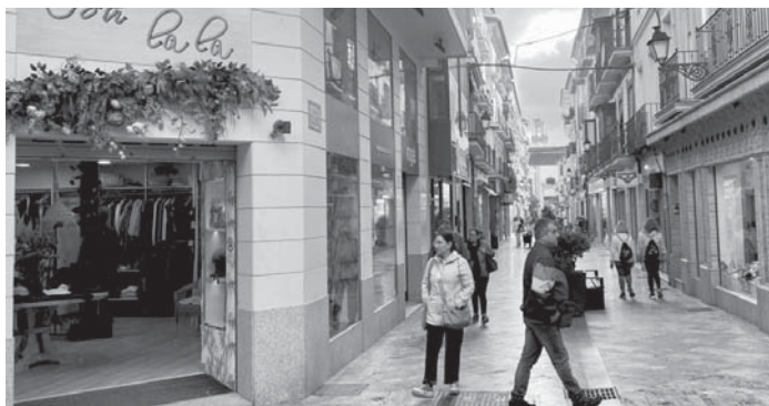
Miembros del laboratorio aceitero de DCOOP. VIVA