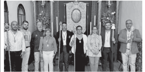
El Rocío de Antequera en Almonte.

Además, el Rocío de Antequera también quiso agradecer a la Hermandad Matriz “por el cálido y generoso recibimiento” brindado durante el fin de semana del mes en cuestión.