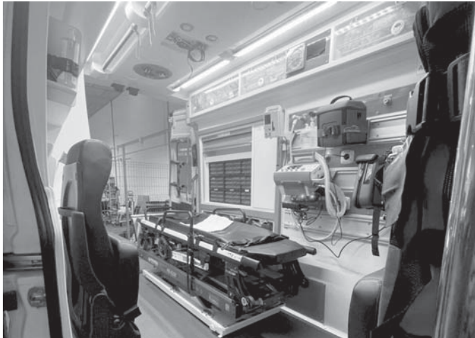
Interior de la ambulancia. VIVA

El nuevo SUAP de Alameda contará con una ambulancia propia y tendrá su base en el consultorio local, ubicado en calle Blas Infante, número 22. El teléfono de información es el 952712509