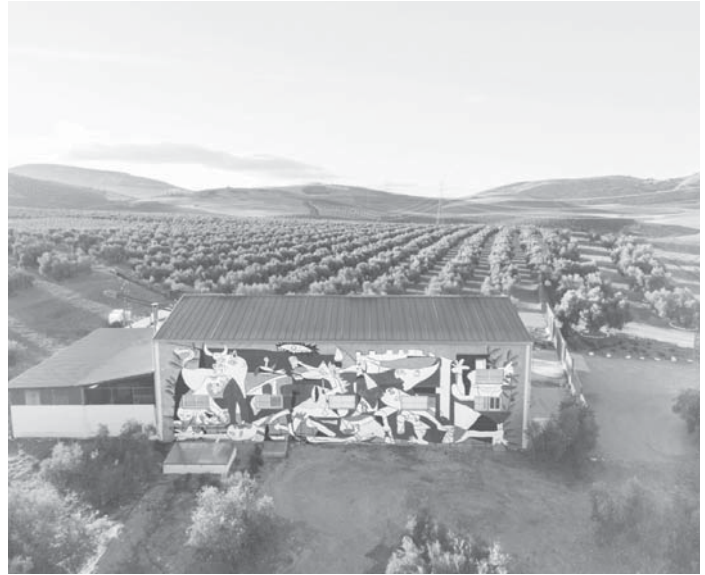
Guernica en Teba.