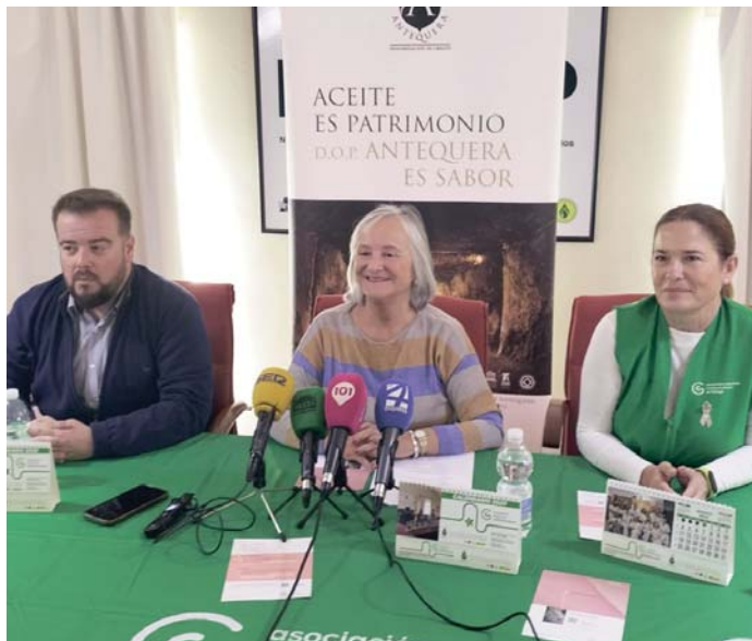
Presentación del calendario VIVA

ANTEQUERA | La Asociación Española Contra el Cáncer en Antequera ha puesto a la venta un millar de calendarios solidarios para recaudar fondos.