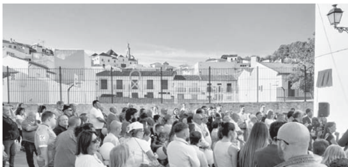
Acto conmemorativo. VIVA