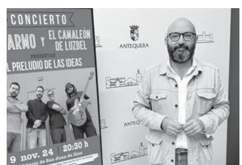
Presentación de la iniciativa VIVA

La entrada a este concierto es libre y gratuita mediante