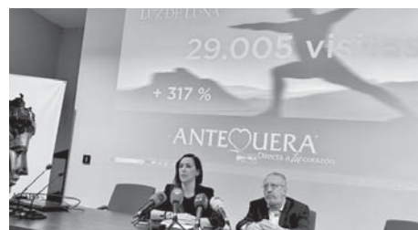
Balance turismo nocturno VIVA

Las actividades desarrolladas en el Conjunto Arqueológico de Los Dólmenes son las que más visitas han acaparado, con un total de 18.635. El Museo de la Ciudad de Antequera (MVCA) ha sido el segundo escenario más visitado, con 5.409 usuarios. El Ayuntamiento ha atribuido este éxito al desarrollo de numerosas actividades complementarias, la nueva reordenación de varias salas y la presencia de la exposición temporal de la Colección Delgado, que incluye obras de destacados artistas como Murillo y Velázquez. Cerca de 3.000 personas han participa-