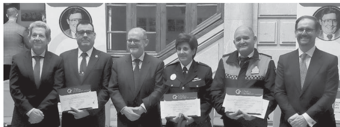
Ganadores del año pasado. VIVA

La organización ha animado a todos los ciudadanos a participar en esta iniciativa que busca agradecer y recompensar el esfuerzo de aquellos profesionales que contribuyen a hacer de Antequera una ciudad segura y de convivencia ejemplar.