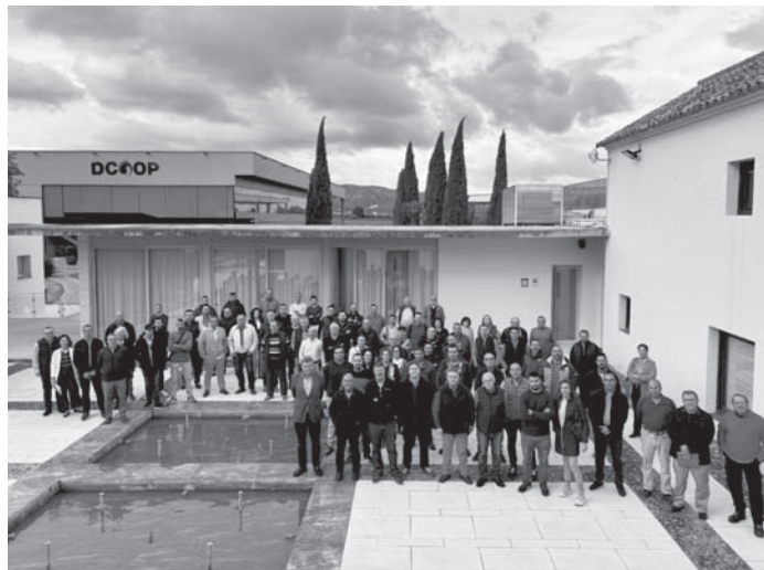
Jornadas de Calidad de Almazaras DCOOP. VIVA

ANTEQUERA | El Auditorio de Dcoop acoge este jueves, 31 de octubre, las Jornadas de Calidad de Almazara 2024/2025 que organiza el departamento de Calidad del Grupo, dirigida a los socios y socias de la sección de Aceite a raíz de la inminente llegada de la campaña. Allí se reúnen más de 150 maestros de almazaras, técnicos de calidad y responsables de cooperativas, de los 100 centros de producción del grupo de toda Andalucía, Extremadura y Castilla-La Mancha. La realización de estas jornadas está promoviendo un incremento en la producción de aceites vírgenes extra, en lo que están influyendo prácticas como el adelanto de la cosecha, mayor limpieza en las almazaras y formación de los maestros.